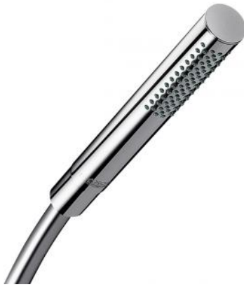
Unterputz Dusch- und Wannenarmaturen Hansgrohe Talis S