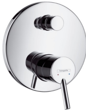
Unterputz Waschtischarmatur Hansgrohe Talis Einhebel für Wandmontage